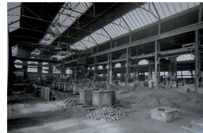
Die Gießerei BOEHRINGER um 1900