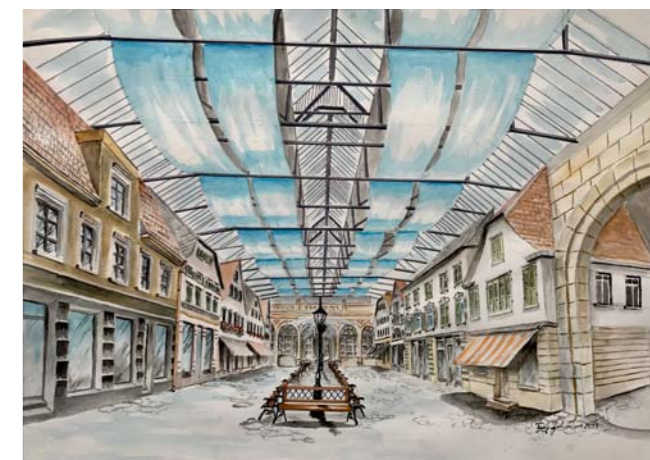
Die Gießerei BOEHRINGER als zukünftige „Handwerksgasse“